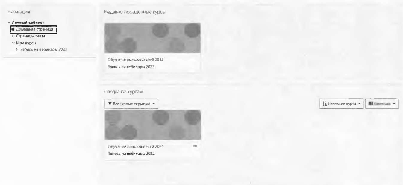
Рис. 2. Главная страница

2. На главной странице Сервиса СДО представлены новости сервиса СДО, а также перечень консультационных курсов (далее – курсы), для просмотра которых необходимо нажать на кнопку «Домашняя страница» и выбрать нужный курс (Рис. 2)